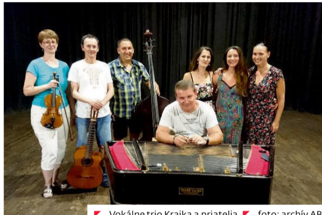
Vokálne trio Krajka a priatelia.

Oni dvaja sú jediní nositelia odkazu úspešnej dosky, ktorú nahral S+H Q pod názvom Jazzové Nebajky.