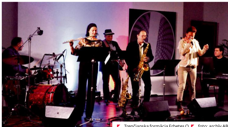
Trenčianska formácia Erbetes Q.