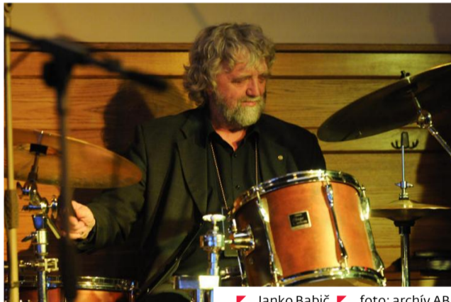
Janko Babič.